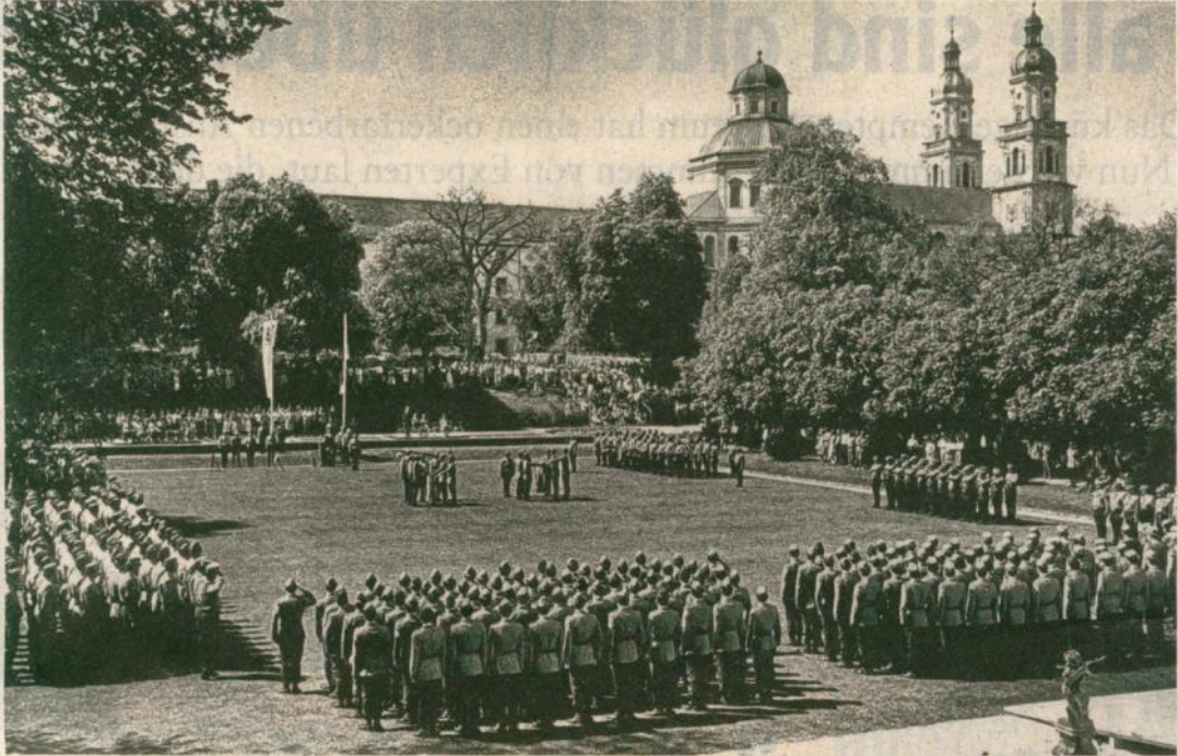
Wenn die Bundeswehr ein feierliches Gelöbnis (wie hier im Hofgarten 1980) abgehalten hat, waren immer viele Bürger dabei.